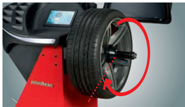
Arresto in posizione

Due operatori possono lavorare contemporaneamente sull'equilibratrice e richiamare rapidamente le dimensioni dei cerchioni.