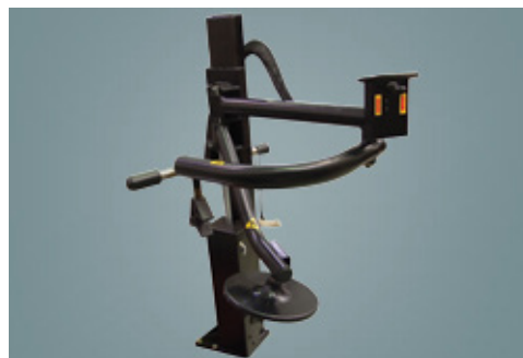
Asistente destalonador de neumático