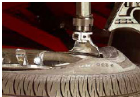
Herramienta de elevación de neumáticos