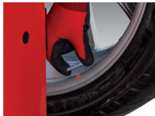
Лёгкая установка груза по лазерной точке