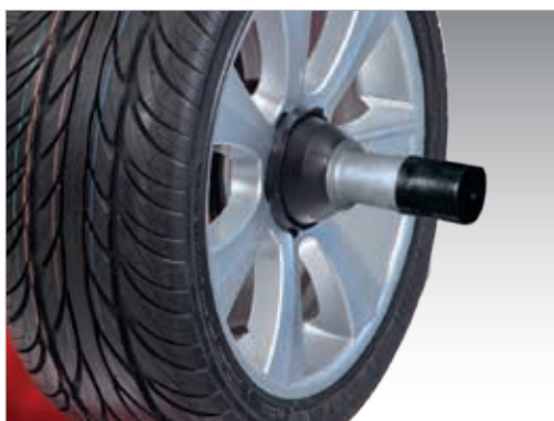
Power Clamp – зажимное устройство