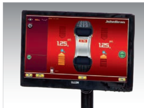
Интерфейс пользователя platinum