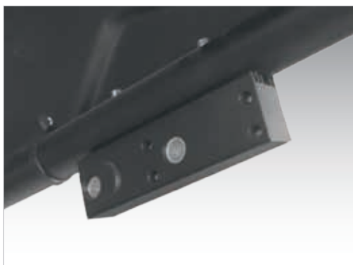
Smart Sonar – уз датчик ширины обода

Монитор с сенсорным экраном, большими цифрами и цветными указателями места установки груза – интуитивно и эргономично.